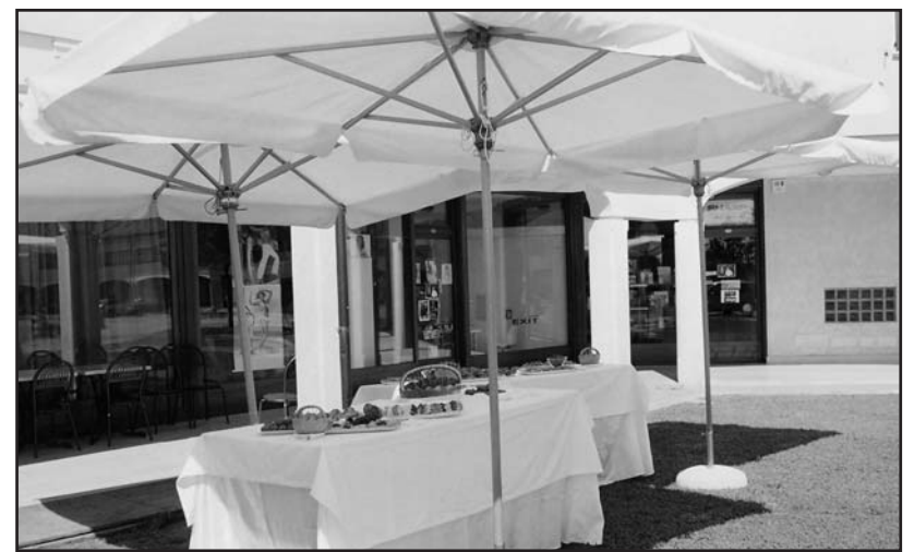
L'organizzazione Roffioli al vostro servizio.

Per informazioni clicca www.pasticceriaroffioli.com oppure tel. 030964969 - cell. 3392808698.