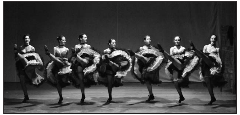
Un noto passo di danza.

E nesimo grande successo dello spettacolo dell'Associazione Studiódanza intitolato "Balliamo sul mondo". Un insieme variegato di stili di danza e colori ha accompagnato i viaggiatori-spettatori in un giro del mondo che ha toccato tutti i continenti.