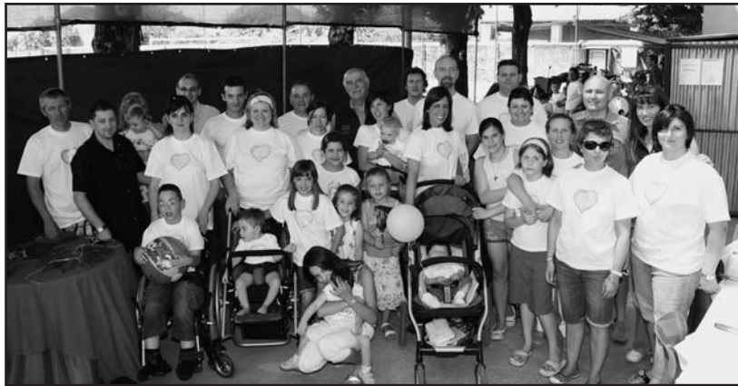
Diversi componenti dell'Associazione "Un sorriso di speranza" con i loro figli.

pediatrica dell'Ospedale di Montichiari- si sono dovuti riunire al fine di "lottare" per mantenere gli attuali livelli di prestazioni fisioterapiche usufruite dai loro bimbi disabili e nell'occasione e' emersa l'esigenza di organizzarsi tramite un ASSOCIAZIONE che abbia come preciso obiettivo la tutela dei diritti dei bimbi disabili nonché favorisca l'integrazione